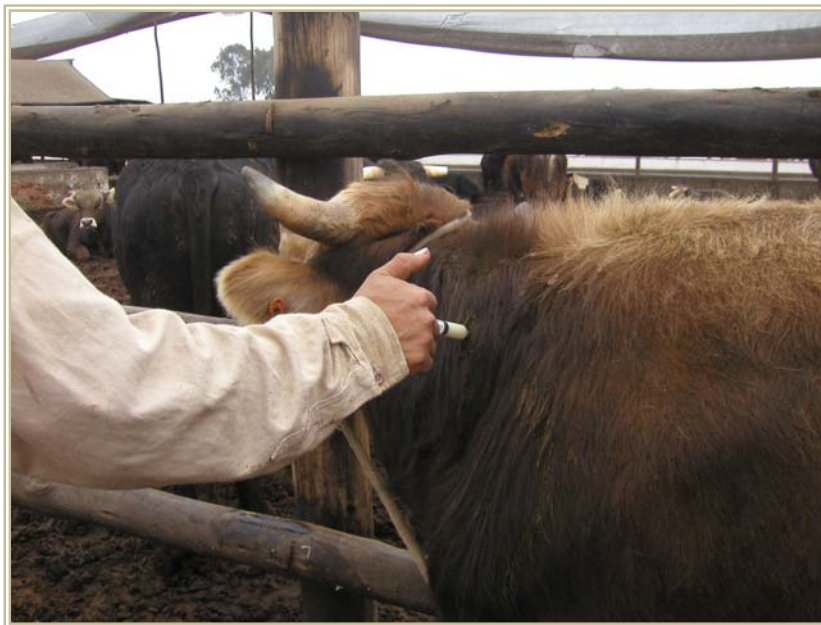
Figura 4. Aplicación de Qrex®