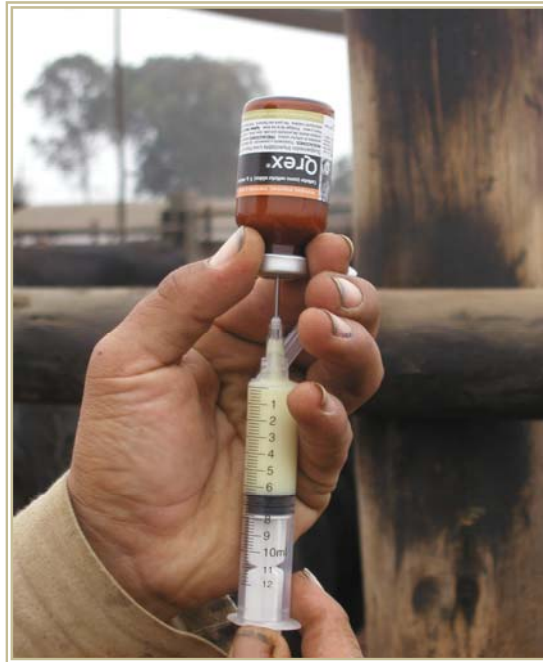
Figura 3. Aplicación de Qrex®