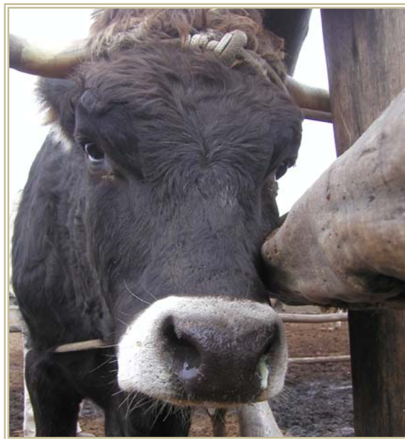
Figura 2. Animal seleccionado