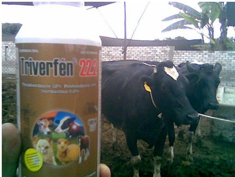
Foto 03. Grupo de vacas dosificadas con Triverfen 22.2® contra piojera