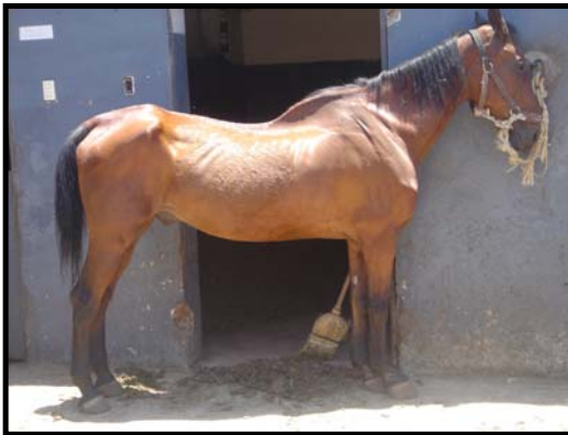
Foto 03. Caballo Nerón antes de la aplicación de Hematofos B12