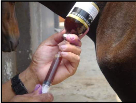
Foto 01. Carga Inicial de Hematofos B12