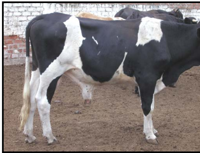
Foto 1: Animal Nº 112 con garrapatas del Genero Boophilus microplus en prepucio.