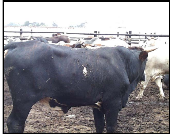
Foto 4 y 5: Animal N° 114 a 30 días de la aplicación de Bovimec® Etiqueta Azul 3.15% Restos cicatrizales de lo que fueron zonas con larvas de Dermatobia homnis .