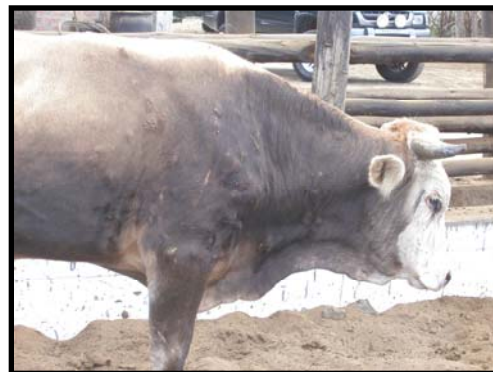
Foto 2 y 3. Animal Nº 118 y 119 con Larvas vivas de Dermatobia hominis al inicio del ensayo.