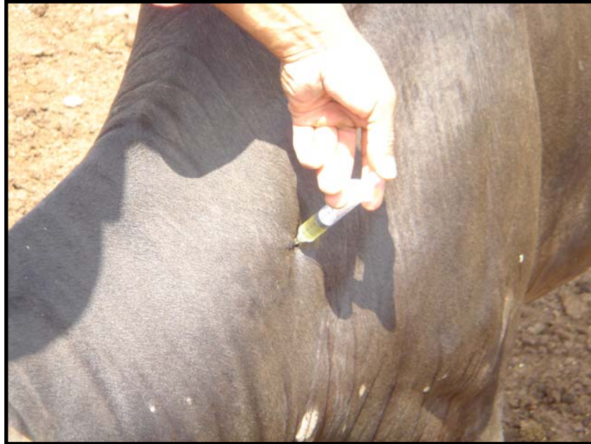
Foto 5. Aplicación vía Intramuscular Profunda de Boldemec® L.A. en la Tabla del cuello

agrovetermarket S.A. creativity in veterinary