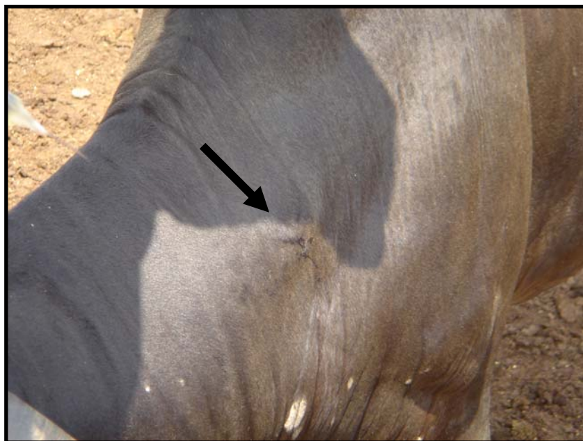
Foto 6. Punto de Aplicación IM después del tratamiento para evaluación de Tolerancia