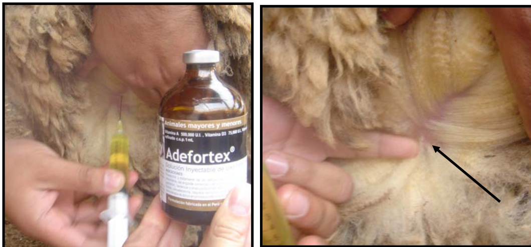
Fotos 03 y 04: Aplicación Intramuscular de Adefortex y determinación del punto de inoculación