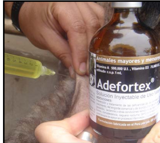
Foto 05 y 06. Aplicación subcutánea de Adefortex en el pliegue de la babilla